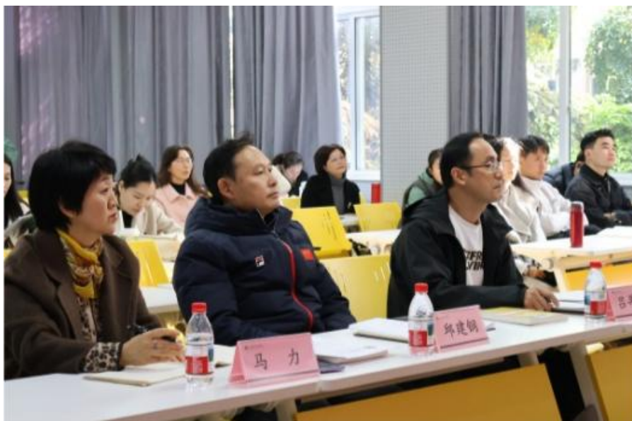
图1 体育与大健康学院公开示范课

坚守“以学生为中心”理念，推动教师角色向学习引导者、课堂组织者和课程设计者转型。建议构建“1+4”教学时间分配模式（即20%课时用于核心讲解，80%留给学生自主探究、分组实践与互助学习）。课程设计应体现阶梯性与差异化，通过“小助手”帮扶、自主探究任务等强化实效。注重大中小体育教育一体化衔接与专业人才差异化培养，聚焦特色项目打造亮点，以多元竞赛体系检验成果，全面提升专业吸引力与毕业生竞争力。