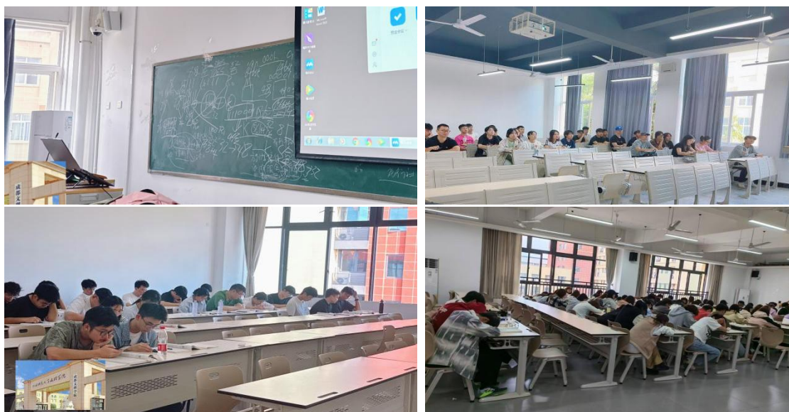
图2 存在的主要问题图片（部分）